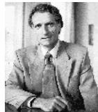
Bertel Haarder, tidl. undervisningsminister og MF for Venstre.

Forældres ret til selv at undervise deres børn er en grundpille i dansk skolefrihedstradition, som ikke lader nogen i tvivl om forholdet mellem stat og borger i Danmark.